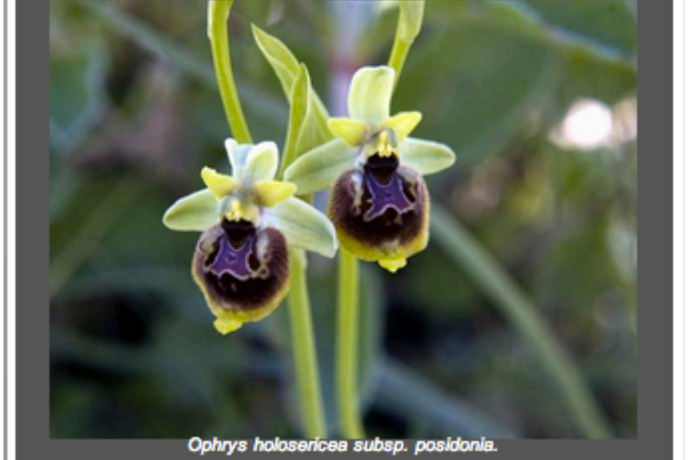
Ophrys holosericea subsp. posidonia.

Indietro | Stampa | Invia | Scrivi alla redazione | Suggestisci