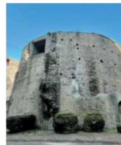
Mausoleo di Augusto

ARTICOLO NON CEDIBILE AD ALTRI AD USO ESCLUSIVO DEL CLIENTE CHE LO RICEVE - 3041